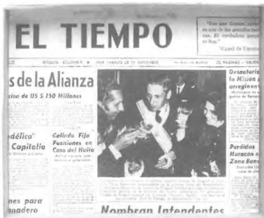
On Kawara «28 Sep. 68», Bogotá