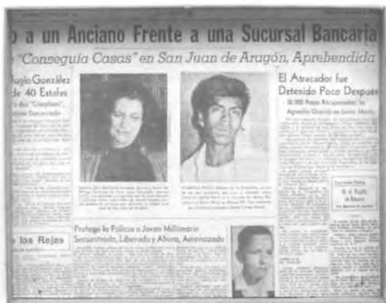
On Kawara »10 May, 68«, Mexico