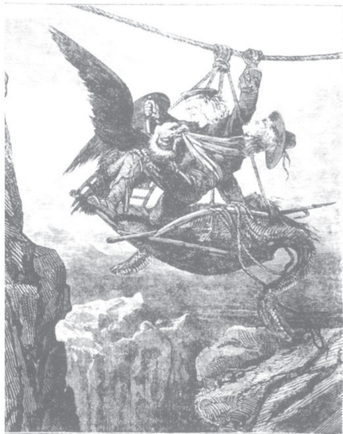
Marceline und Marie (unisono): »Geliebter Bräutigam, Wirkung und Verlangen offenbaren mir, daß Du der Gott meines Herzens und mein Besitz für alle Ewigkeit bist.« Der Adler: »Schlagt zu! Denn nur schwerlich kann ich mich aufrecht halten, und ich bin völlig nackt: ich bin der unbeweibte Gott.«

konnte da nur einen aufreibenden Kampf verlieren. Bei dem Stichwort »Grab« muß sie an die Höhle im Baum des Märchens denken, welche die Einschränkung symbolisiert. So erlebt sie auch ihr Leben: Das war zwar kein körperlicher Tod, aber seelisch war vieles totgemacht in bedrückender Resignation und Aussichtslosigkeit. Zu den Inhalten des Koffers kommt der Gedanke, daß sie da Inhalte auspacken müsse, von denen der Traum handelt (s. die drei Wendungen), wenn ihre Lebensgeschichte anders »ausgehen« solle. Gelänge es ihr, ihre Geheimnisse zu lüften, könne sie wieder zum Leben erwachen, davon scheint ihr der Dialog des Traums zu sprechen. Geheim hält sie die Feindseligkeit gegen die Mutter,