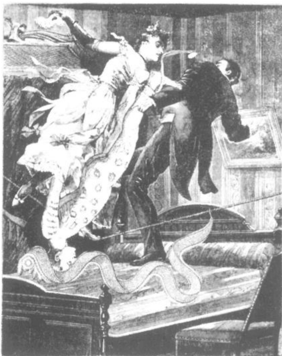
»Auf in die Finsternis, tanz mit mir den Hexentanz...«

Zentral ist in dem Märchen ein maßloser Anspruch auf Alles , auf gottähnliche ungeheuerliche Verwandlungsmöglichkeiten, der sich in ein Nichts (Einöde, Vertreibung aus dem Paradies) verkehren kann. Eine immense Neu-Gier, in der kindliche Allmacht sowie der Wunsch nach nicht versiegender Versorgung und wortlosem Verstehen (Symbiose) weiterlebt, sucht sich paradoxerweise einer Begrenzung zu widersetzen, indem aktivisch eine Beschränkung auf sich genommen wird. Man verstummt, engt seinen Bewegungs-Radius bis zu lebensbedrohlicher Zuspitzung (Vernichtung, Scheiterhaufen) ein, um nicht von der Illusion zu lassen, ein Himmelskind zu sein, und um zugleich der verspürten Forderung nach Mäßigung scheinbar Rechnung zu tragen. Auch wenn die Entfaltungsmöglichkeiten noch so verkürzt sind, den goldenen Finger